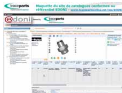
Les données catalogues des fournisseurs ayant adopté le référentiel commun EDONI peuvent être consultables gratuitement en ligne sur le site www.traceparts.com .