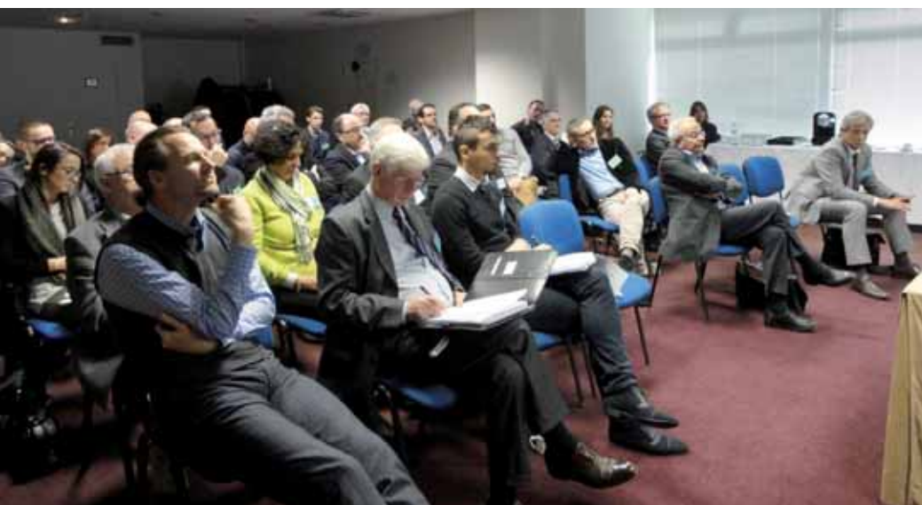
Une quarantaine de personnes ont participé à la journée organisée par Edoni en partenariat avec le Cetim et la Fim autour de la qualité des données produits numérisées.

Pour la description technique des produits, le référentiel commun EDONI intègre le modèle eCl@ss, standard de classification et de codification de données relatives aux